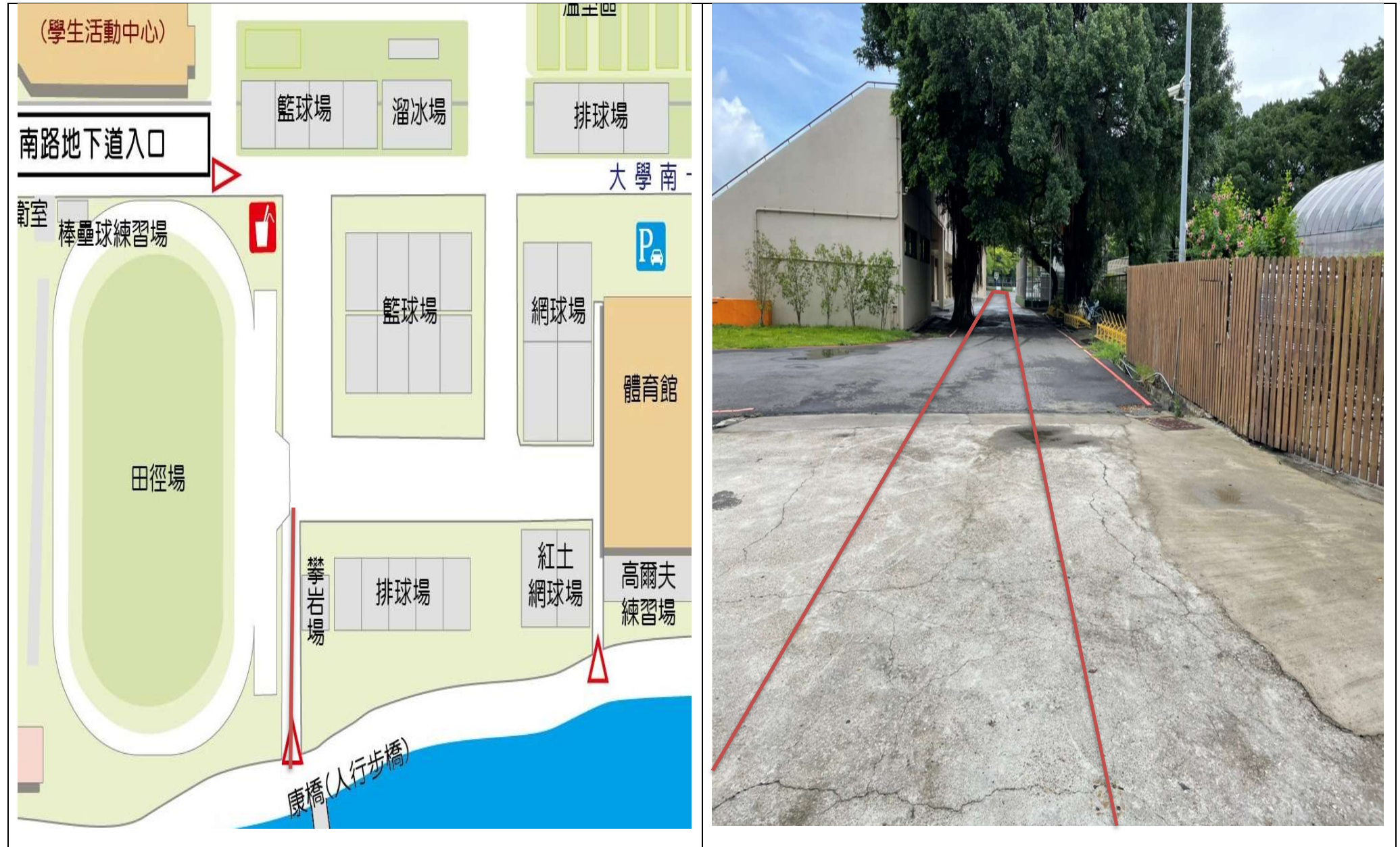
【校區污水下水道(含建物接管)及弱電共同管路建置工程施工範圍及位置圖】

※110年7月27日(二)至8月7日(六)校區污水下水道(含建物接管)及弱電共同管路建置工程施工通知※詳如紅色標記處