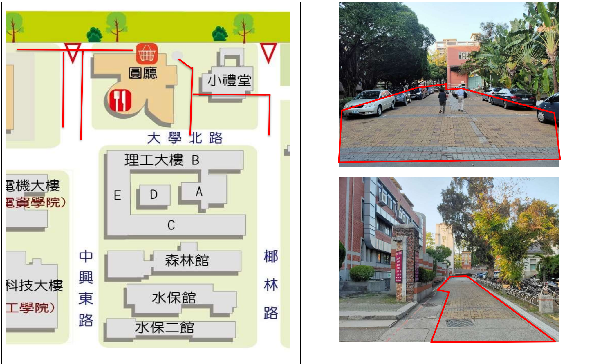
【校區污水下水道(含建物接管)及弱電共同管路建置工程施工範圍及位置圖】

※111年2月21日(一)至3月31日(四)污水下水道建物接管及弱電共同管路工程施工通知※詳如紅色標記處