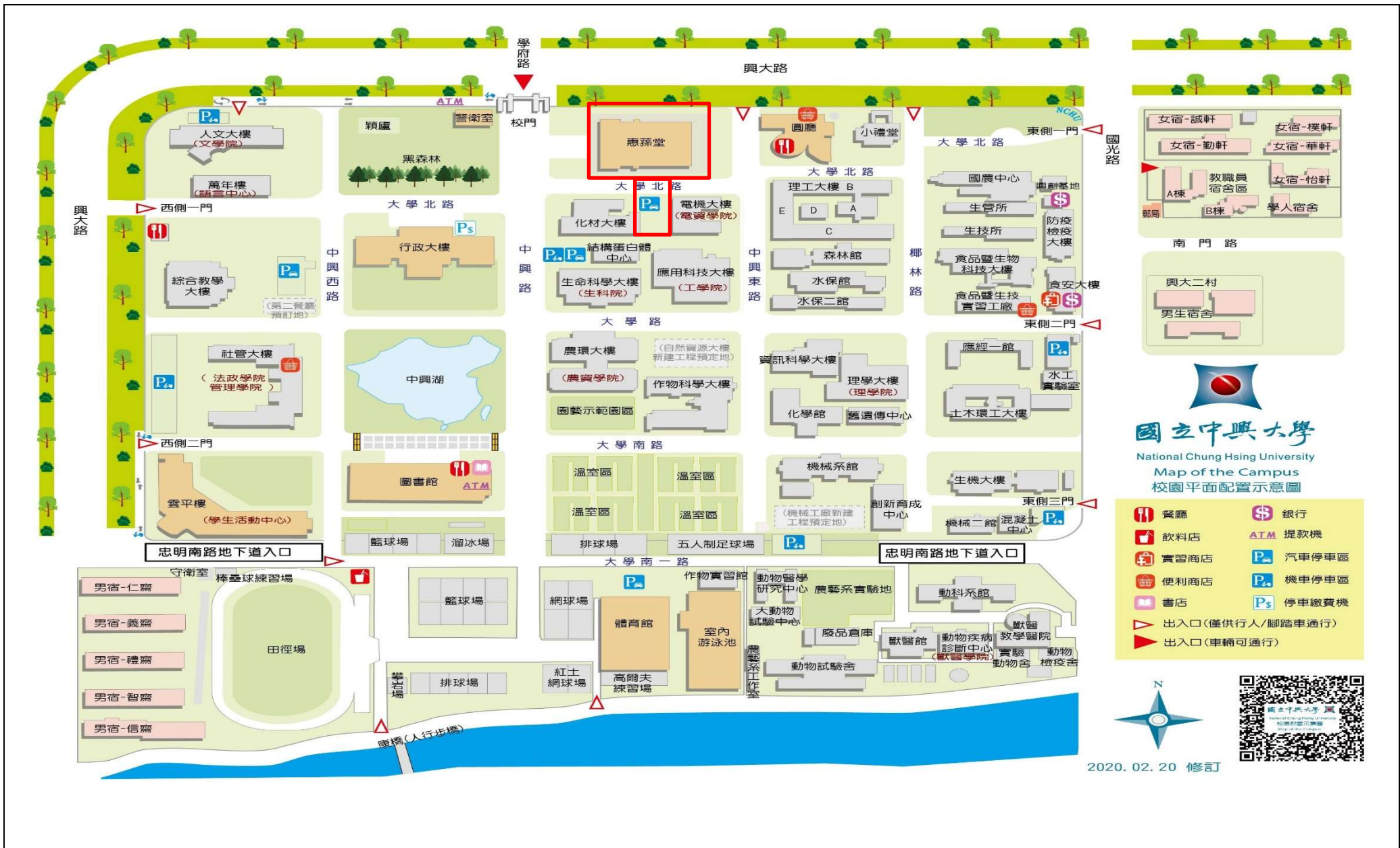
【惠蓀堂人行地坪及化材館旁停車場化糞池打除施工範圍及位置圖】