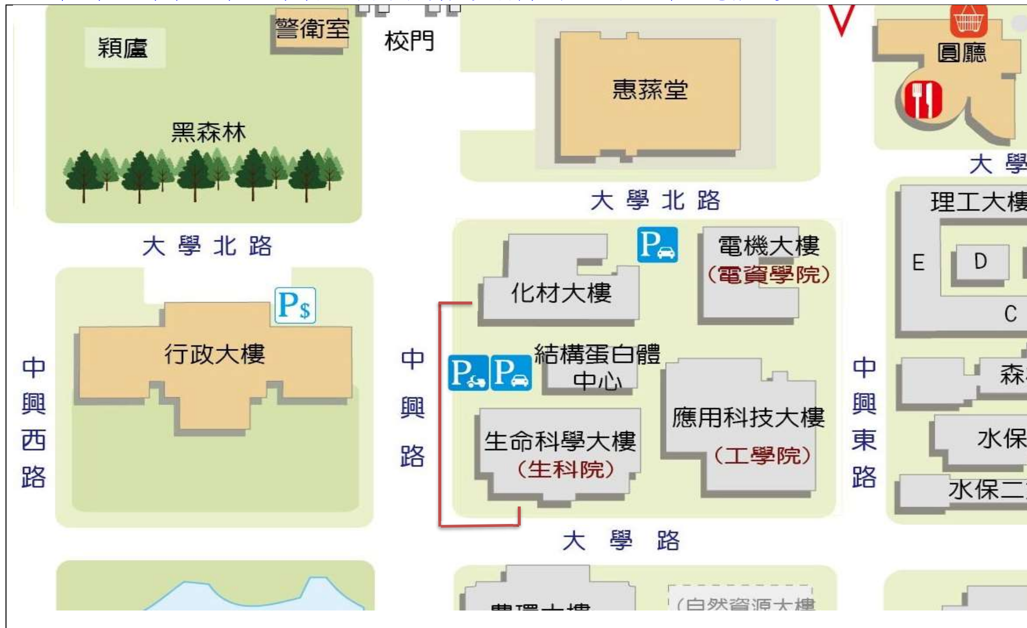
【校區污水下水道(含建物接管)及弱電共同管路建置工程施工範圍及位置圖】

※111年6月13日(一)至6月17日(五)校區污水下水道(含建物接管)工程施工通知※詳如紅色標記處