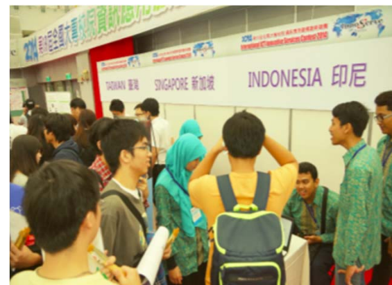
海外團隊展示交流實況