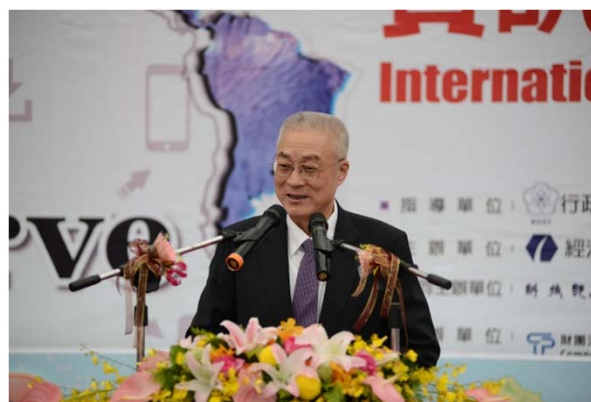
吳副總統現場致詞