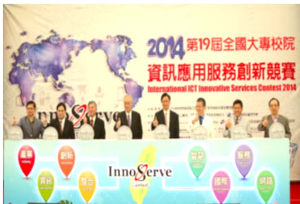
副總統親臨現場開幕