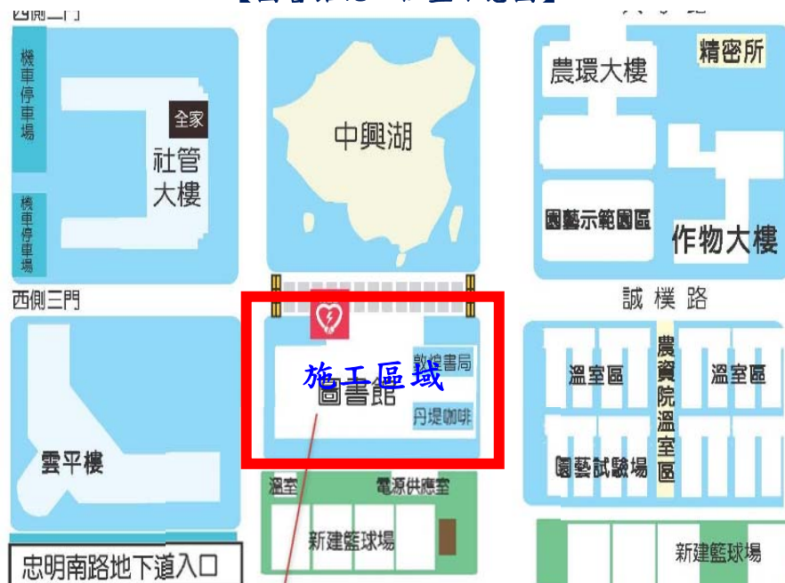
【圖書館施工位置示意圖】