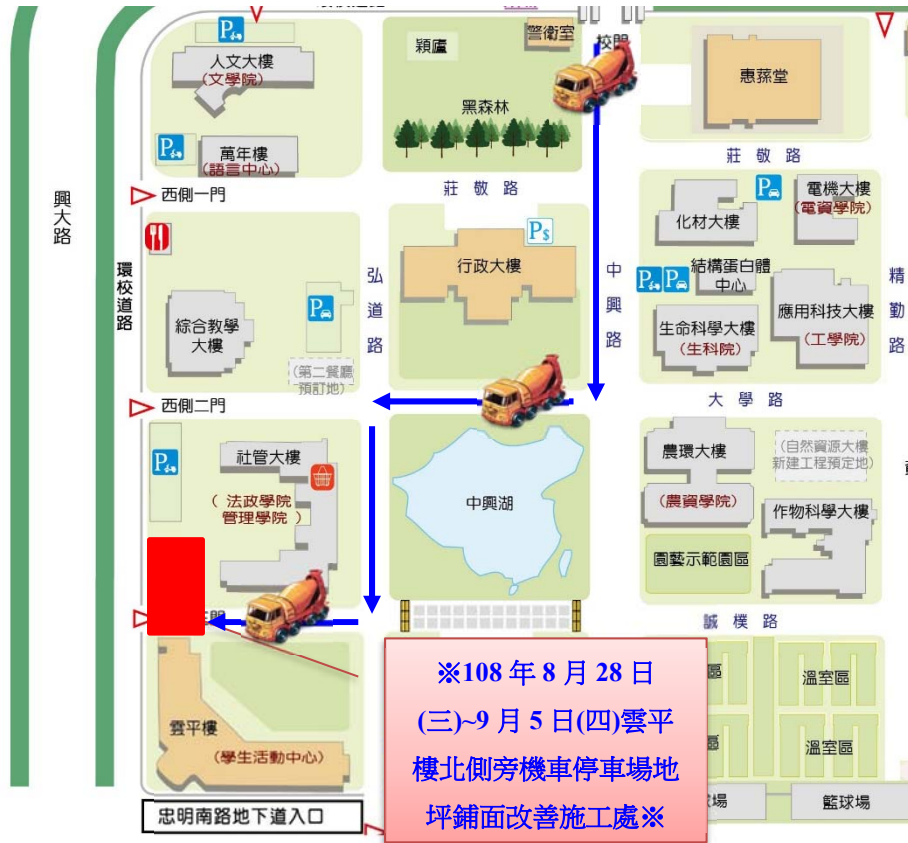
【雲平樓北側旁機車停車場地坪鋪面改善施工位置示意圖】