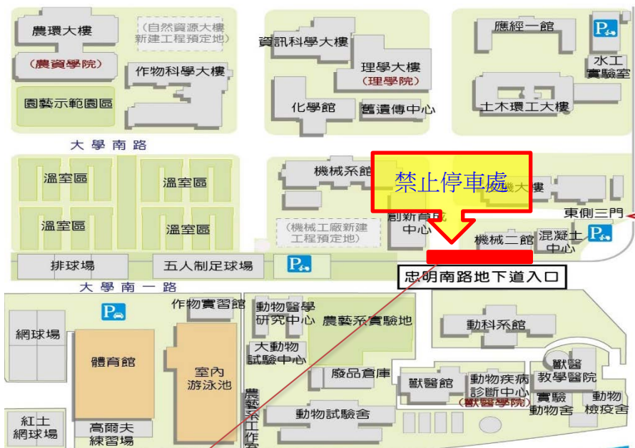
【忠明南路地下道上方部分路面下陷位置施工示意圖】

※109年10月22日(四)臺中市政府辦理忠明南路地下道上方下陷修復施工通知※-施工處如紅色標示區