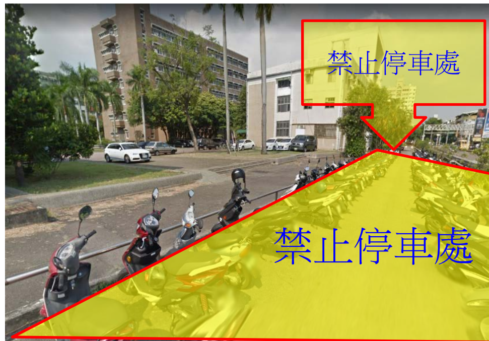
【忠明南路地下道上方部分路面下陷施工禁止停車處示意圖】