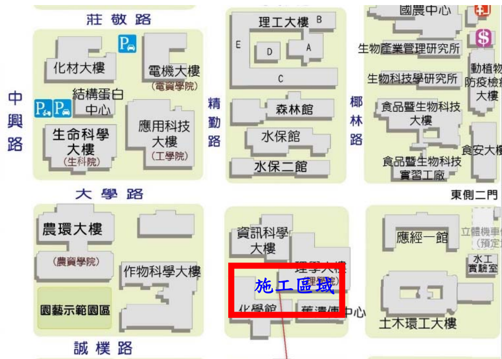
【理學院大樓及化學系館連接天橋施工位置】

※108年1月12日至3月12日理學大樓西側鋼架天橋油漆工程施工通知※-施工處如紅色標示區