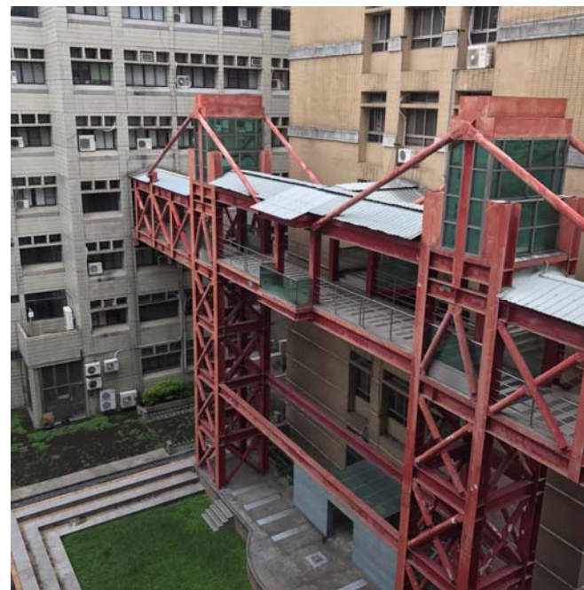
【理學院大樓及化學系館連接天橋現況】