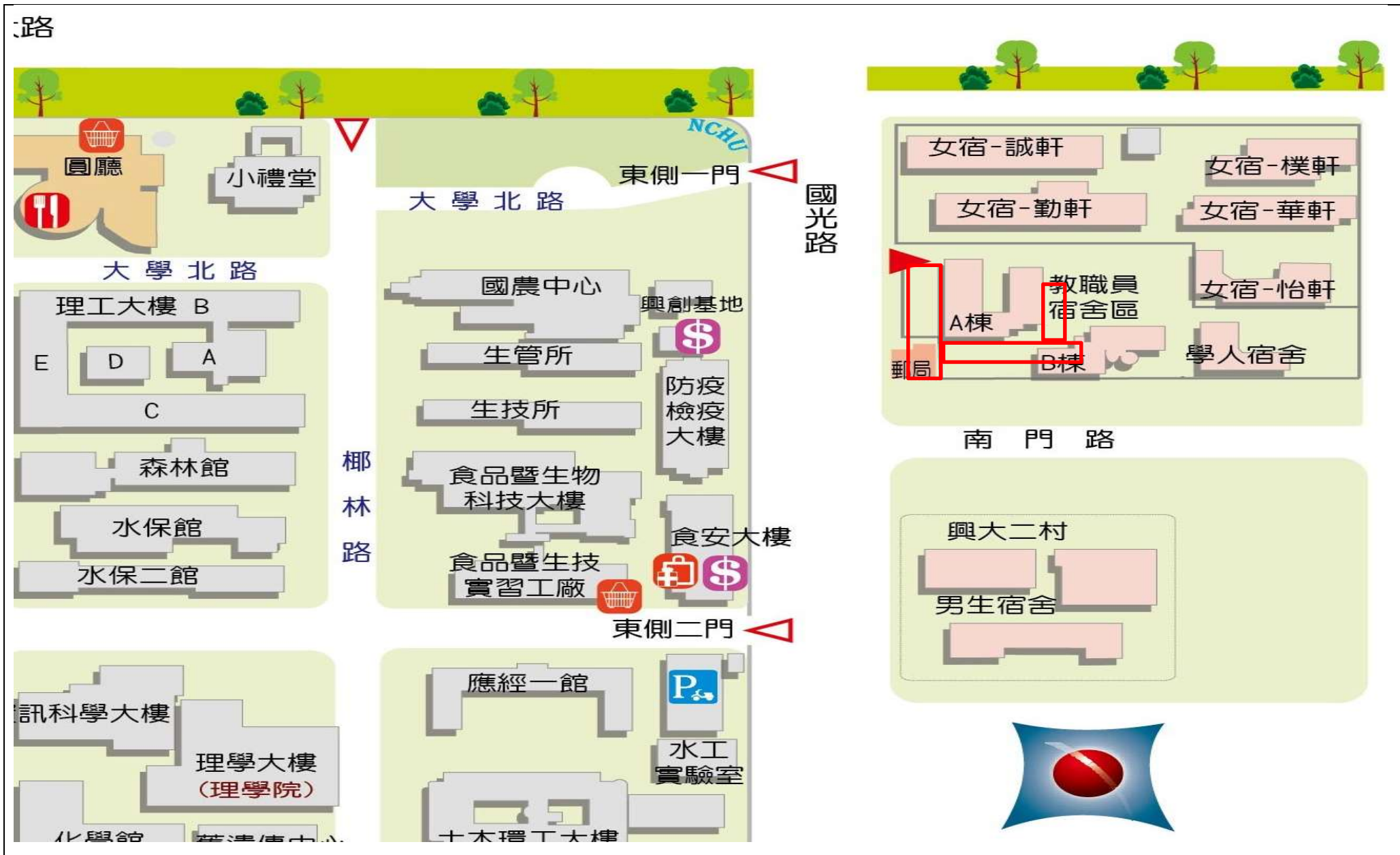
【校區污水下水道(含建物接管)及弱電共同管路建置工程施工範圍及位置圖】

※111年4月2日(六)至4月11日(一)校區污水下水道(含建物接管)工程施工通知※詳如紅色標記處