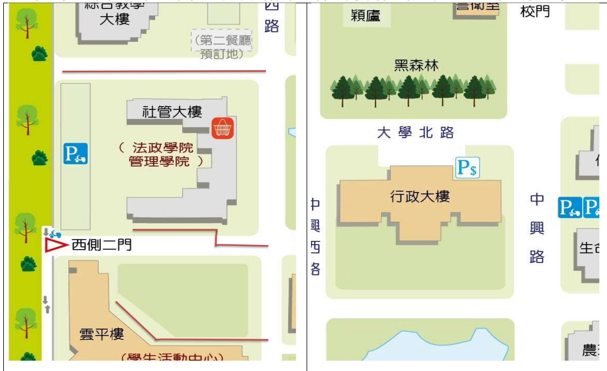
【校區污水下水道(含建物接管)及弱電共同管路建置工程施工範圍及位置圖】

※110年11月05日(五)至12月18日(六)校區污水下水道(含建物接管)及弱電共同管路建置工程施工通知※詳如紅色標記處