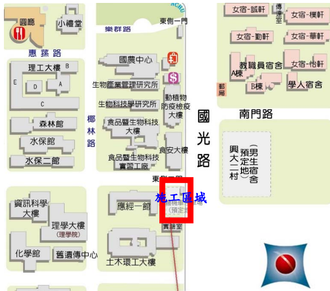
【立體機車停車場施工位置示意圖】

※107年12月25日(二)~108年7月31(三)立體機車停車場興建工程施工處※