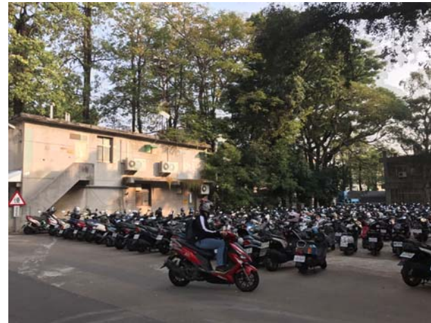
【立體機車停車場圍籬搭設範圍】