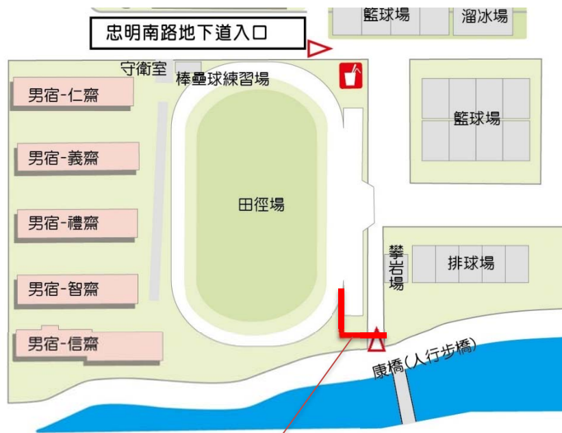
【排水溝改善位置圖】