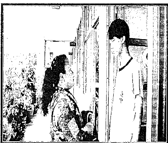
新住民媽媽送外套到學校來，兒子一臉不耐煩，還向同學說，這是我家的「菲傭」。