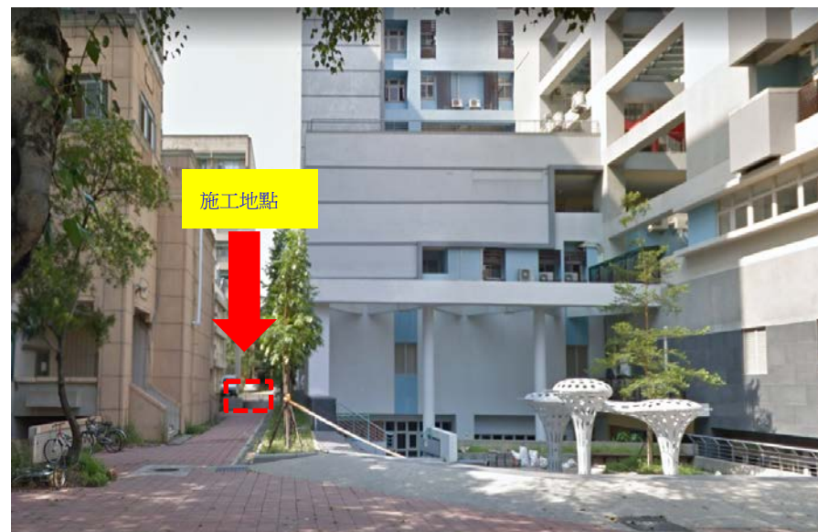
【「應用科技大樓」及「蛋白體中心」間施工區域】

※109年08月26日 (三)~8月31日(一)應 用科技大樓北側AC 鋪設工程施工處※