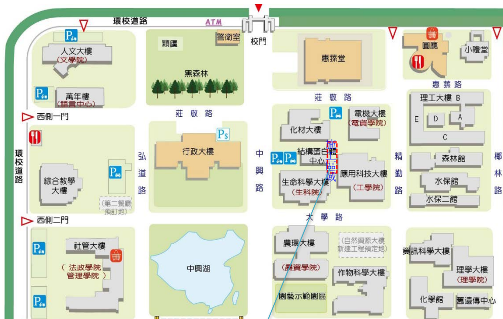
【「應用科技大樓」及「蛋白體中心」間施工區域】

※109年08月26日 (三)~8月31日(一)應 用科技大樓北側AC 鋪設工程施工處※