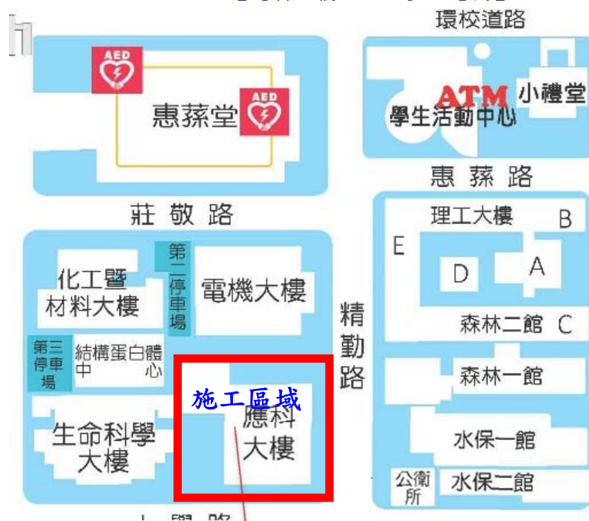
【應科大樓施工位置示意圖】

※107年12月17日(一)~108年3月15日(五) 應用科技大樓地下室階梯教室整修工程施工處※