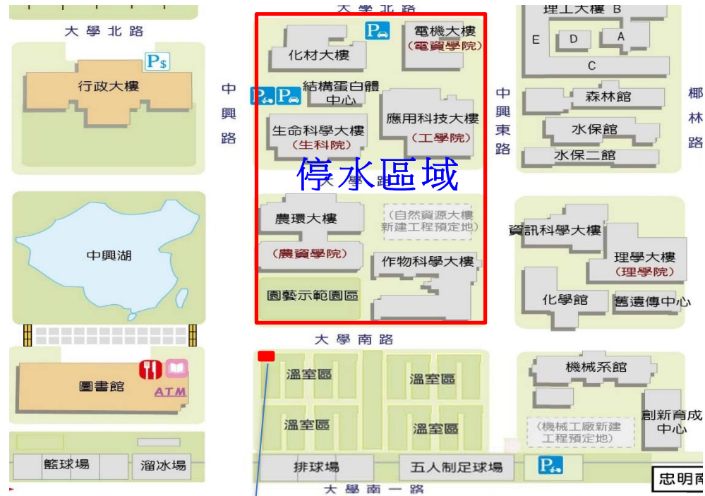
【溫室區地下水管線施工施工處示意圖】