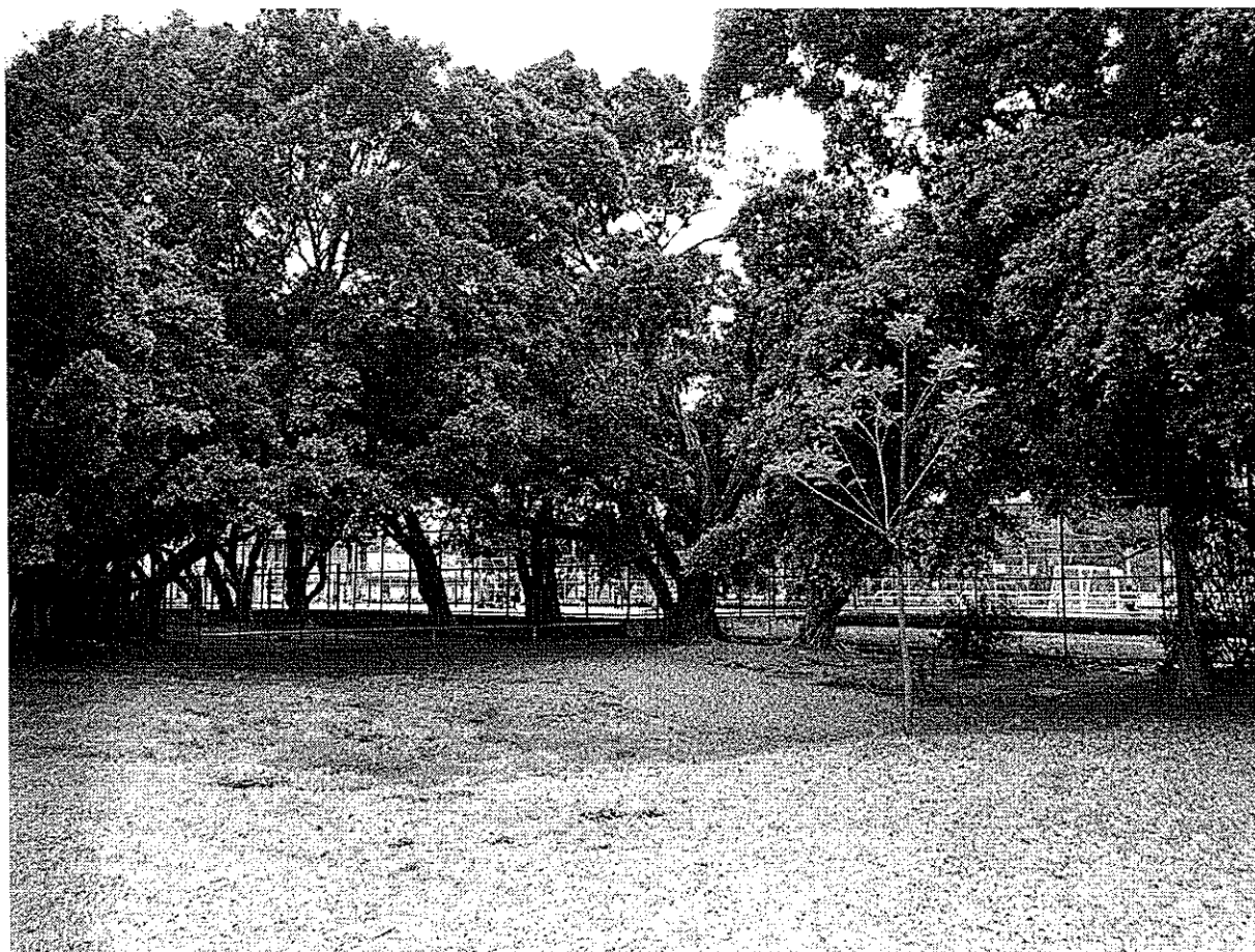
4. 健身器材旁草皮及碎石子區-2