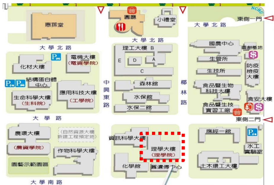
【理學大樓一樓 A03 施工位置示意圖】