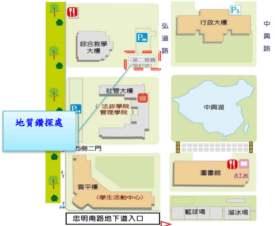
【第二餐廳地質鑽探工程位置圖】