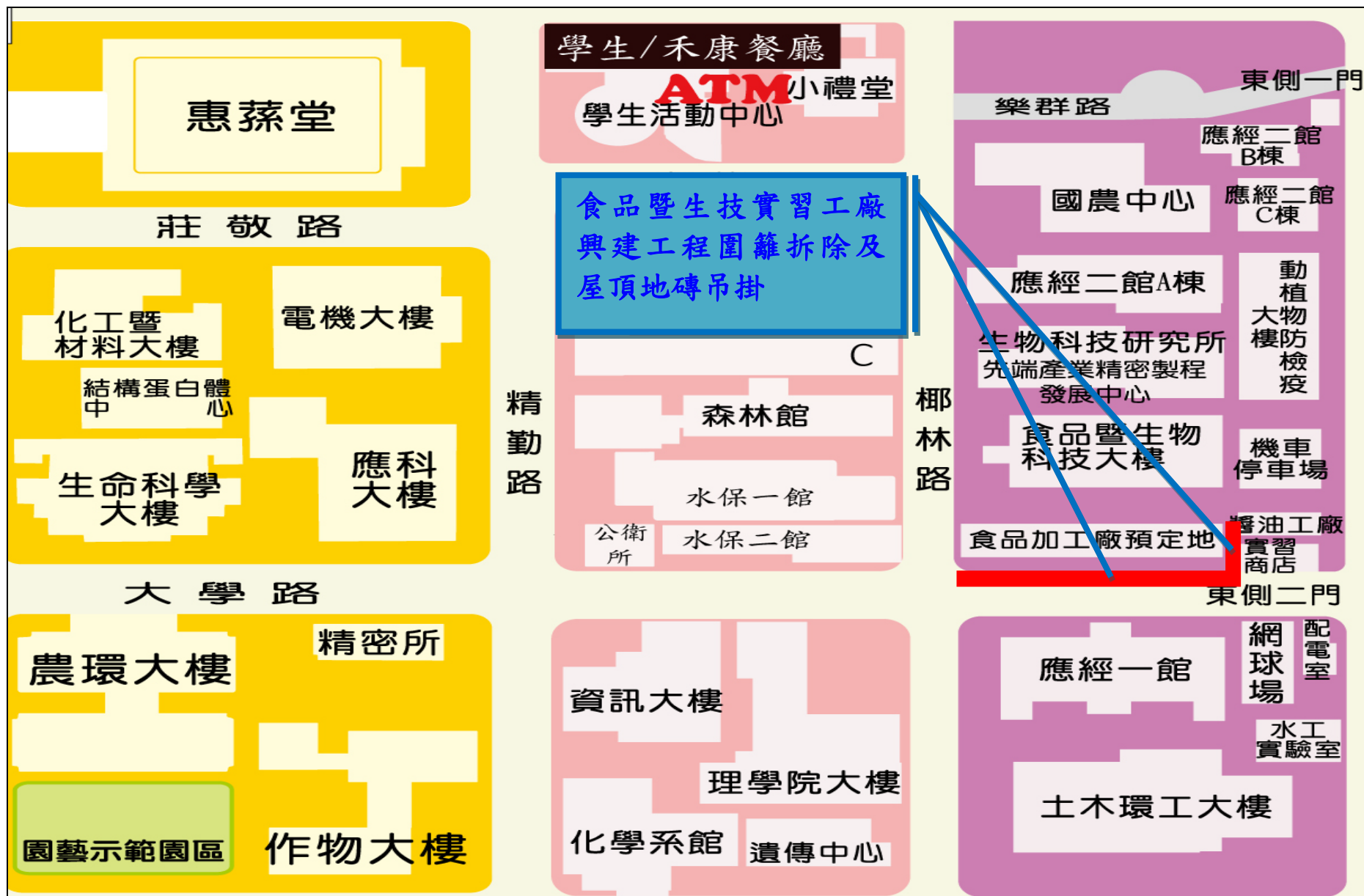
「食品暨生技實習工廠興建工程圍籬拆除及屋頂地磚吊掛作業」-道路封閉位置如紅色標示處