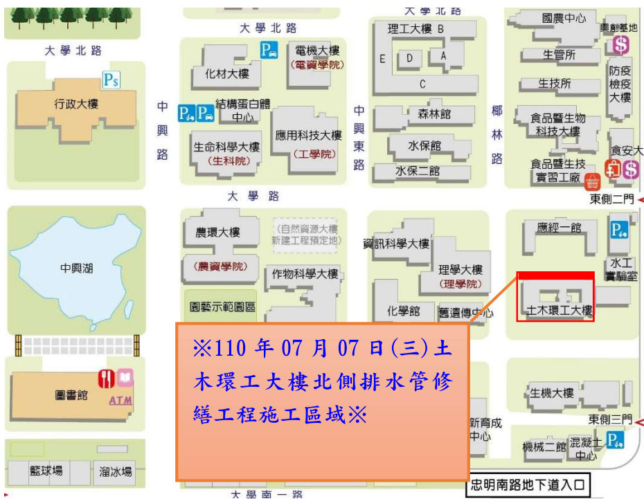
【土木環工大樓施工位置示意圖】