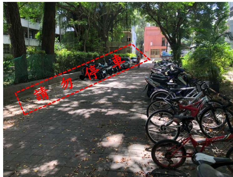
【土木環工大樓北側外牆施工位置地現況】