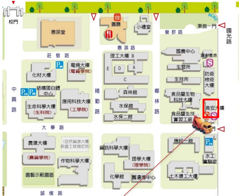
【食安大樓施工位置示意圖】

※108年10月07日(一)食安大樓二期機電工程混凝土澆置作業施工通知※-施工處如紅色標示區