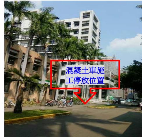
【混凝土車行經路線】