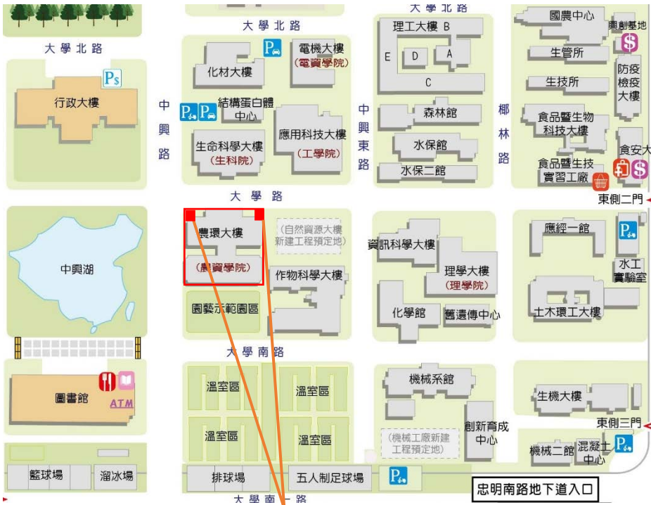
【農環大樓施工位置示意圖】

※109年07月16日(四)~07月20日(一)農環大樓東西兩側外牆雨遮增設工程施工區域※