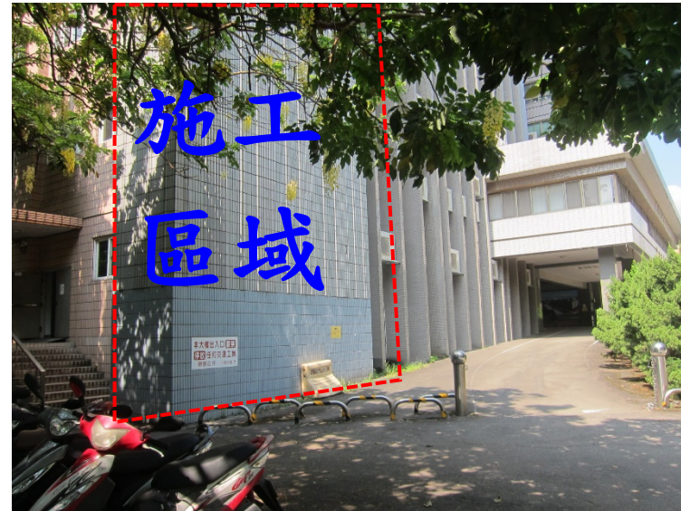
【農環大樓西側外牆施工位置地現況】