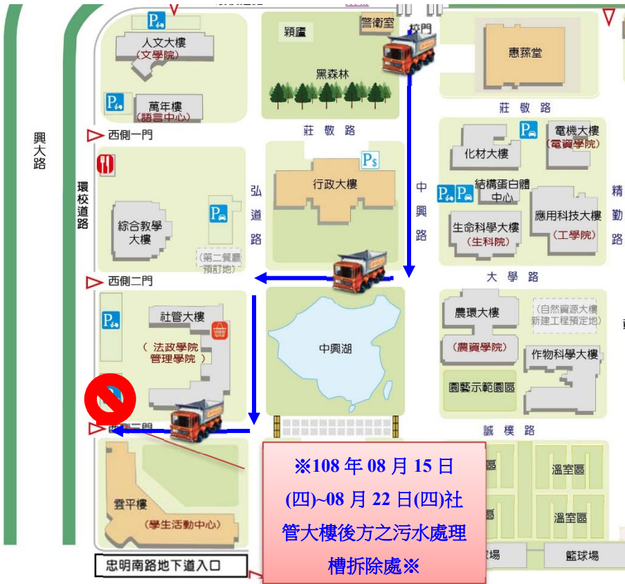
【社管大樓後方之污水處理槽拆除施工位置示意圖】