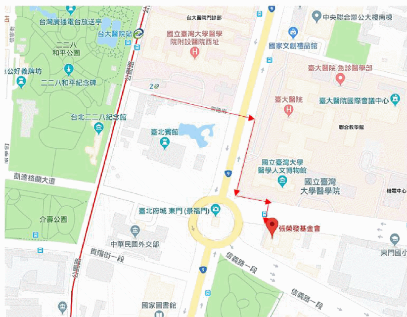
圖 1、捷運台大醫院站步行路線