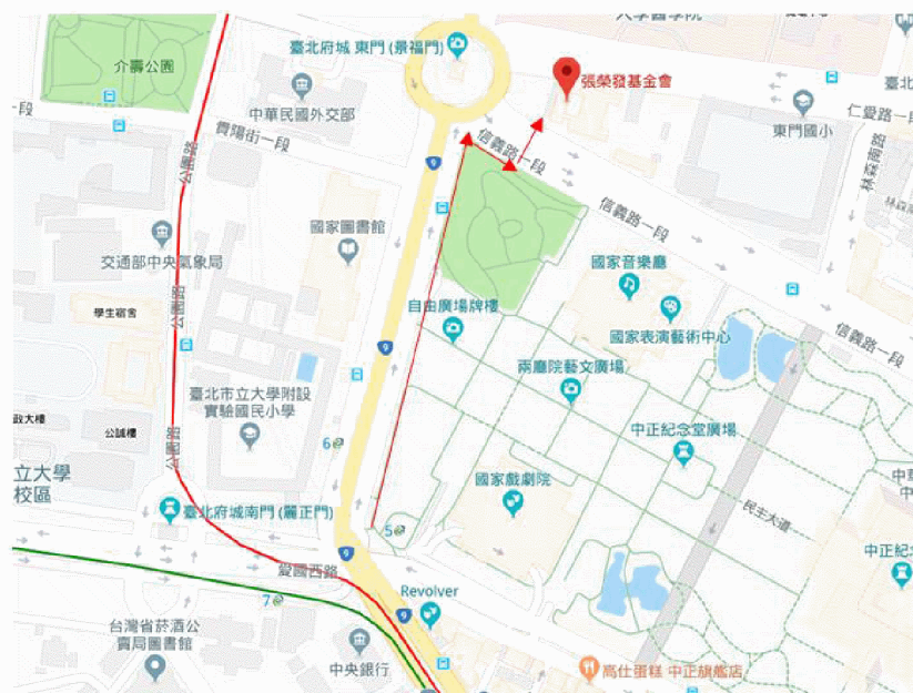
圖 2、捷運中正紀念堂站步行路線