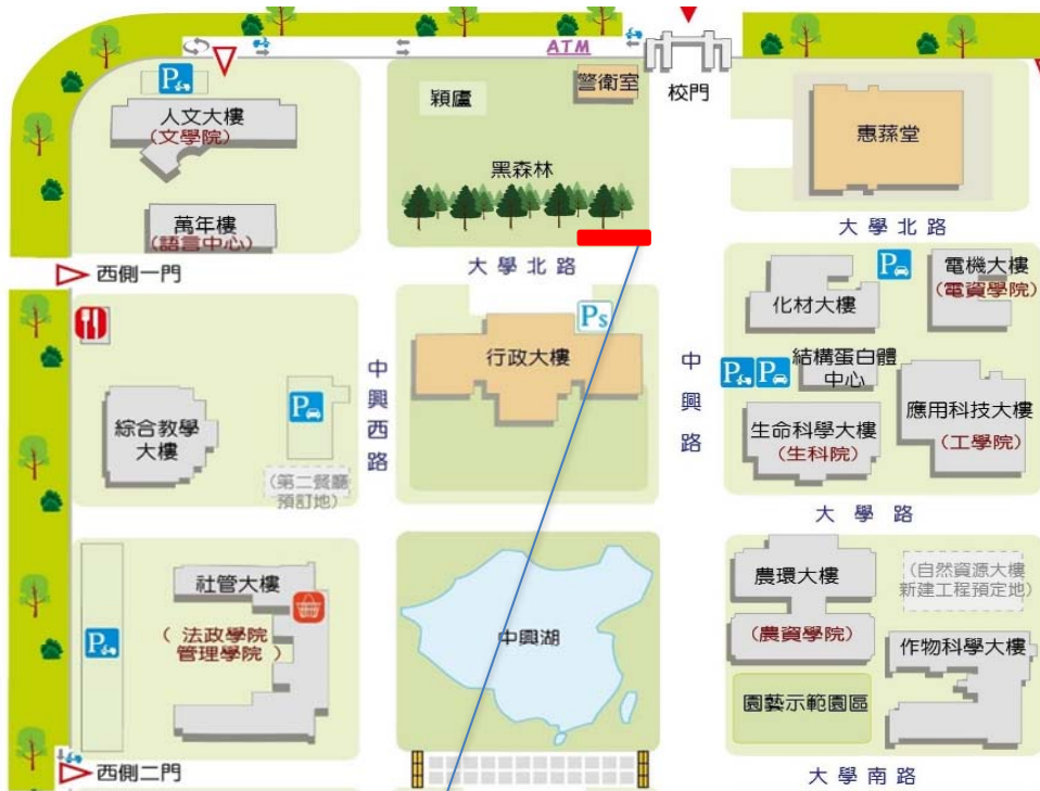
【黑森林步道南側前地下幹管施工施工處示意圖】