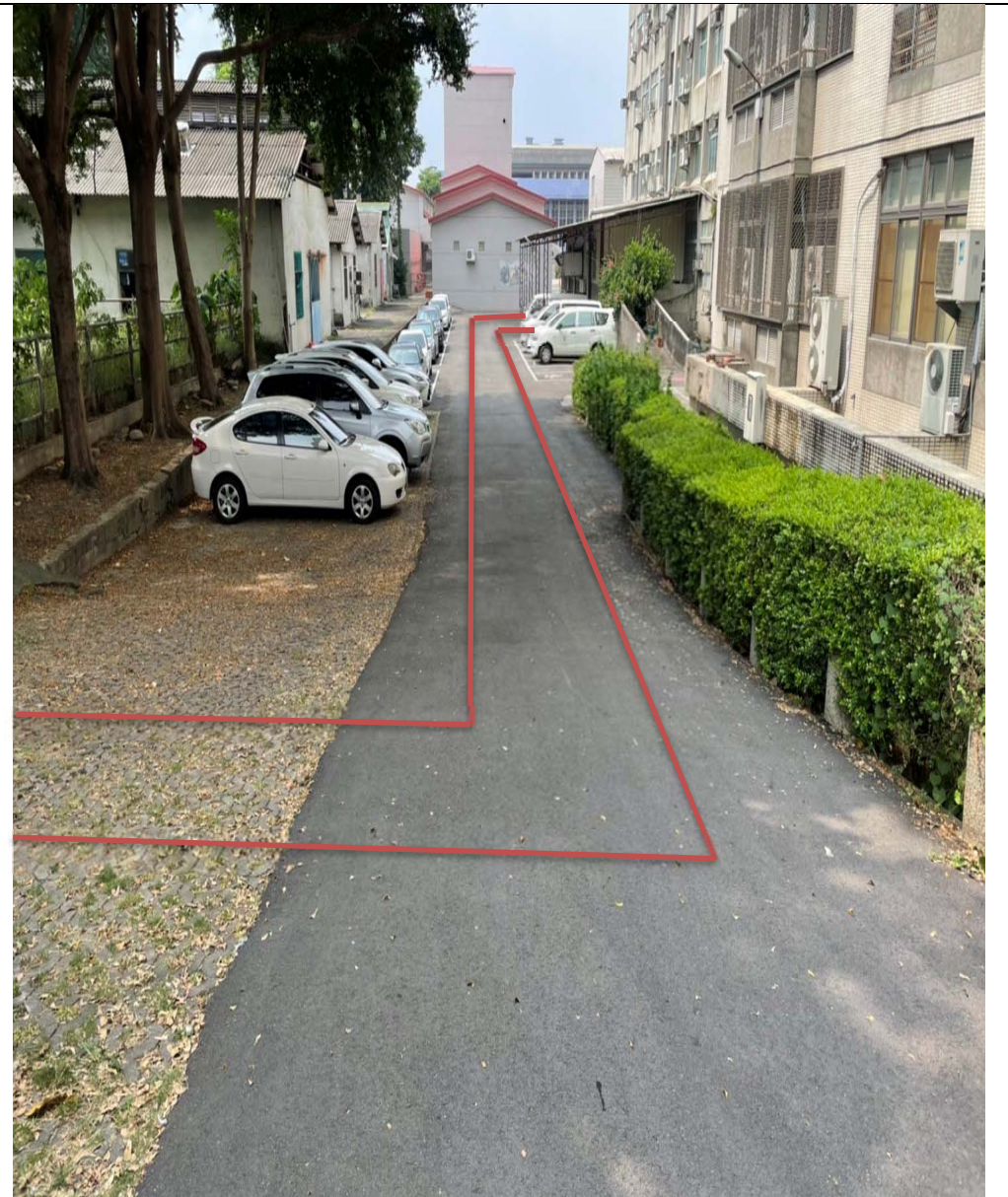
【校區污水下水道(含建物接管)及弱電共同管路建置工程施工範圍及位置圖】