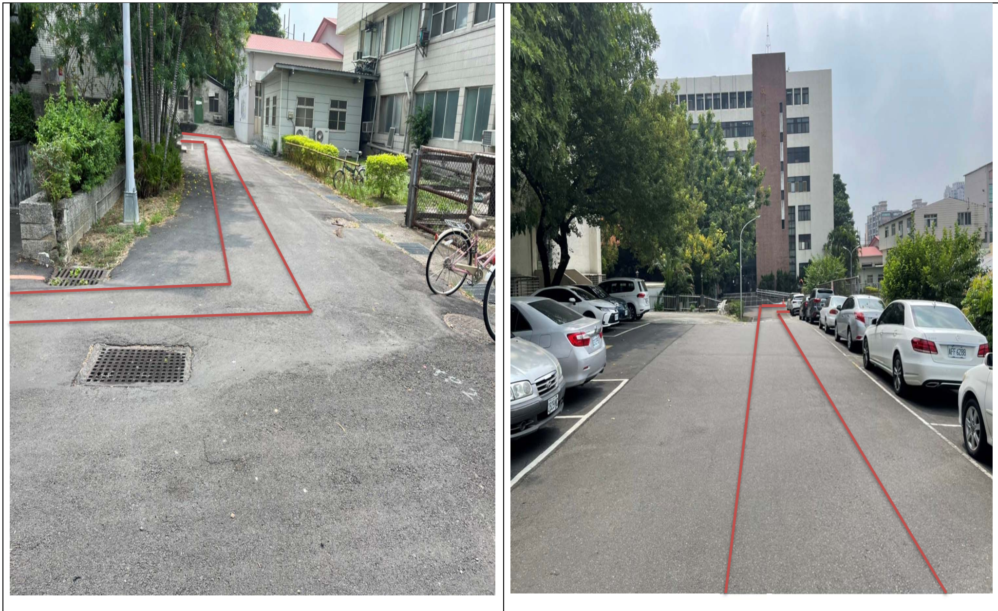
【校區污水下水道(含建物接管)及弱電共同管路建置工程施工範圍及位置圖】

※110年10月04日(一)至10月30日(六)校區污水下水道(含建物接管)及弱電共同管路建置工程施工通知※詳如紅色標記處