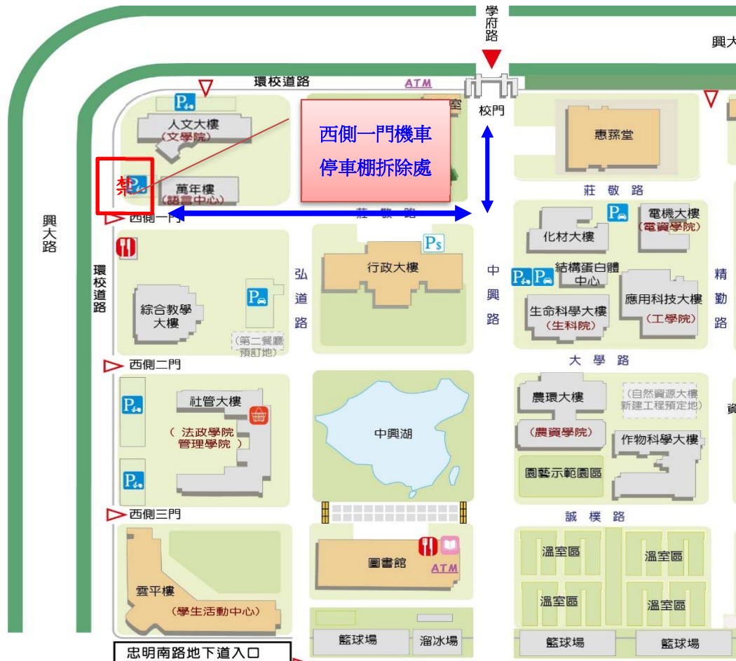
【語言中心西側一門機車棚拆除施工位置及清運路線示意圖】