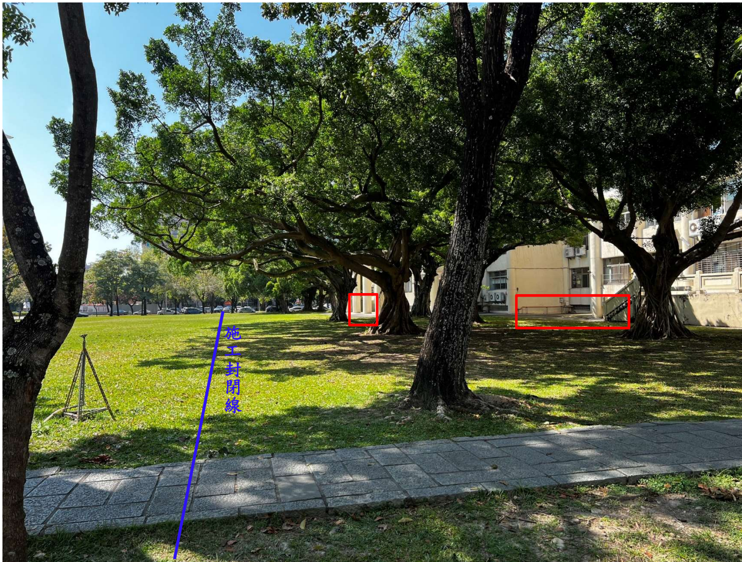
【校區污水下水道(含建物接管)及弱電共同管路建置工程施工範圍及位置圖】

※111年4月2日(六)至4月11日(一)校區污水下水道(含建物接管)工程施工通知※詳如紅色標記處