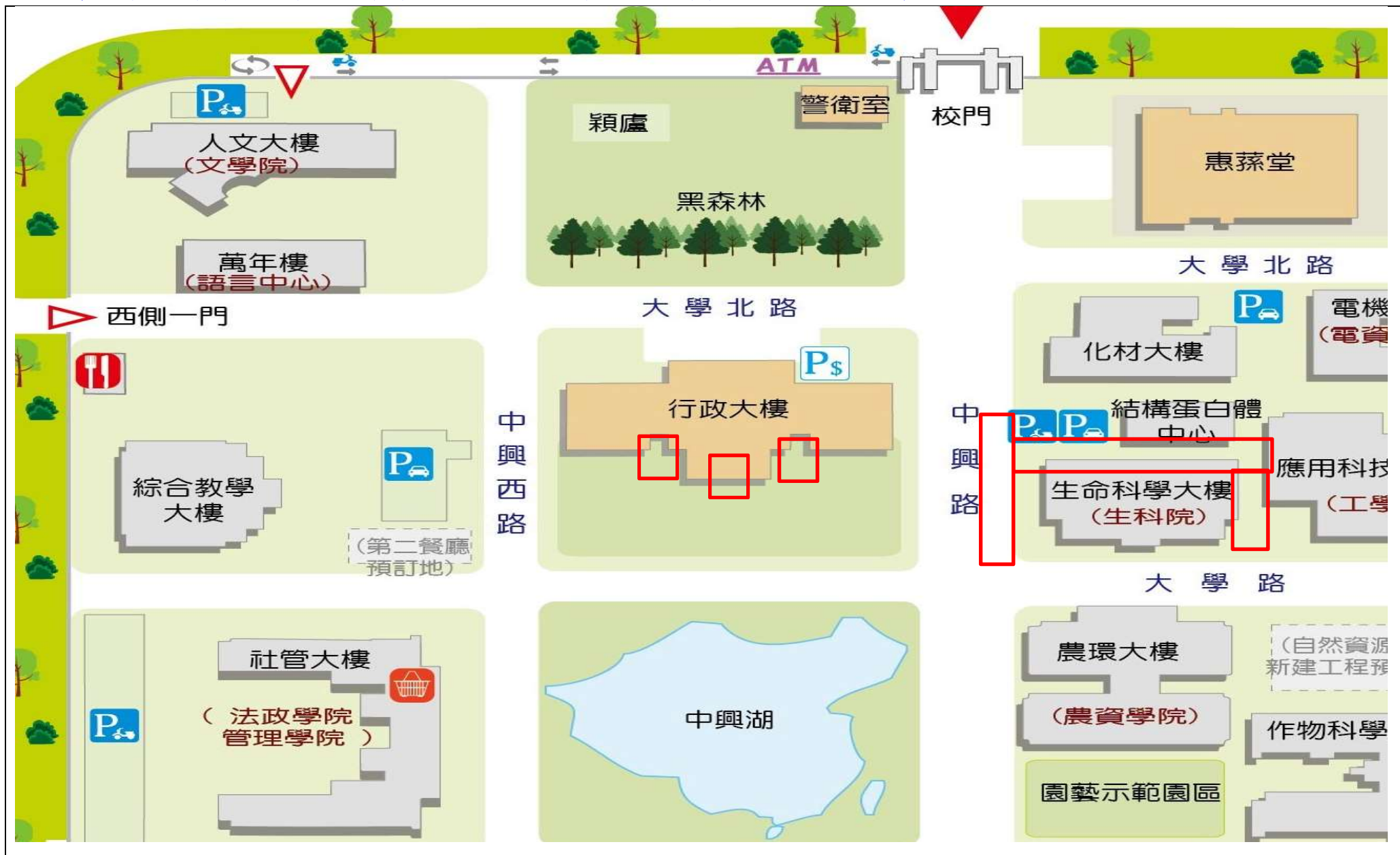
【校區污水下水道(含建物接管)及弱電共同管路建置工程施工範圍及位置圖】

※111年4月2日(六)至4月11日(一)校區污水下水道(含建物接管)工程施工通知※詳如紅色標記處