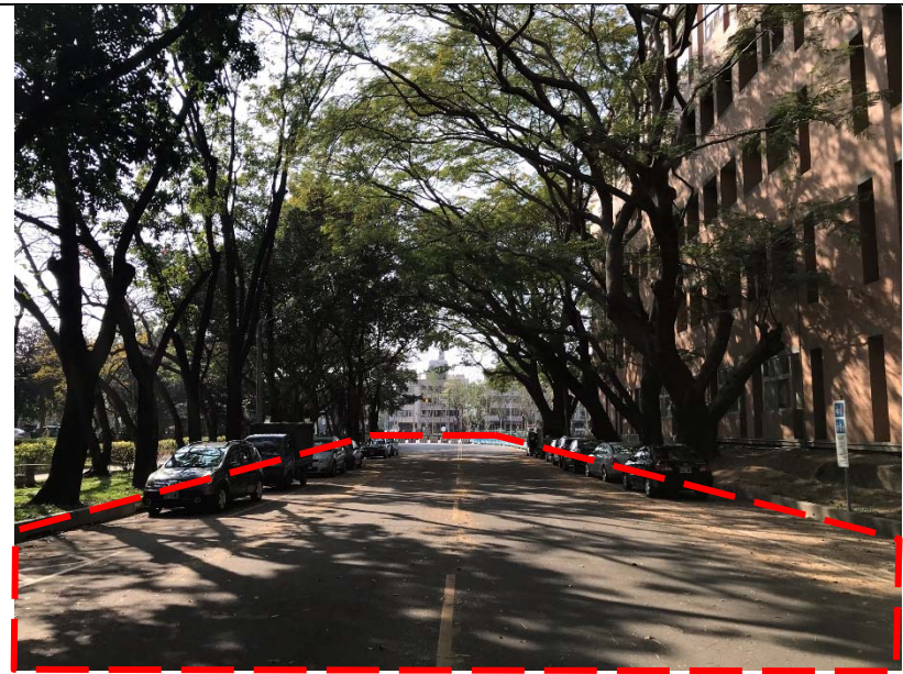
【西側門出入口安全島新建工程位置圖】