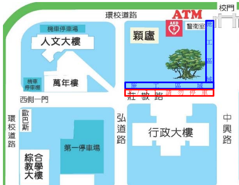
【黑森林東側及南側步道施工區域】