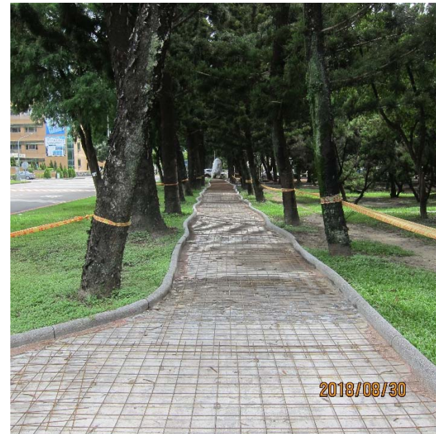
【8/31 黑森林東側混凝土澆置作業區】