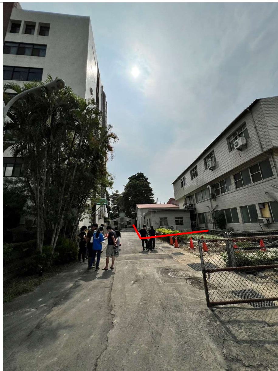
【校區污水下水道(含建物接管)及弱電共同管路建置工程施工範圍及位置圖】