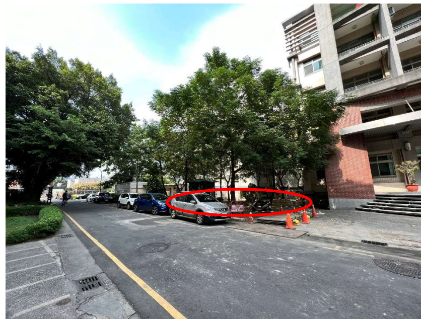
【校區污水下水道(含建物接管)及弱電共同管路建置工程施工範圍及位置圖】