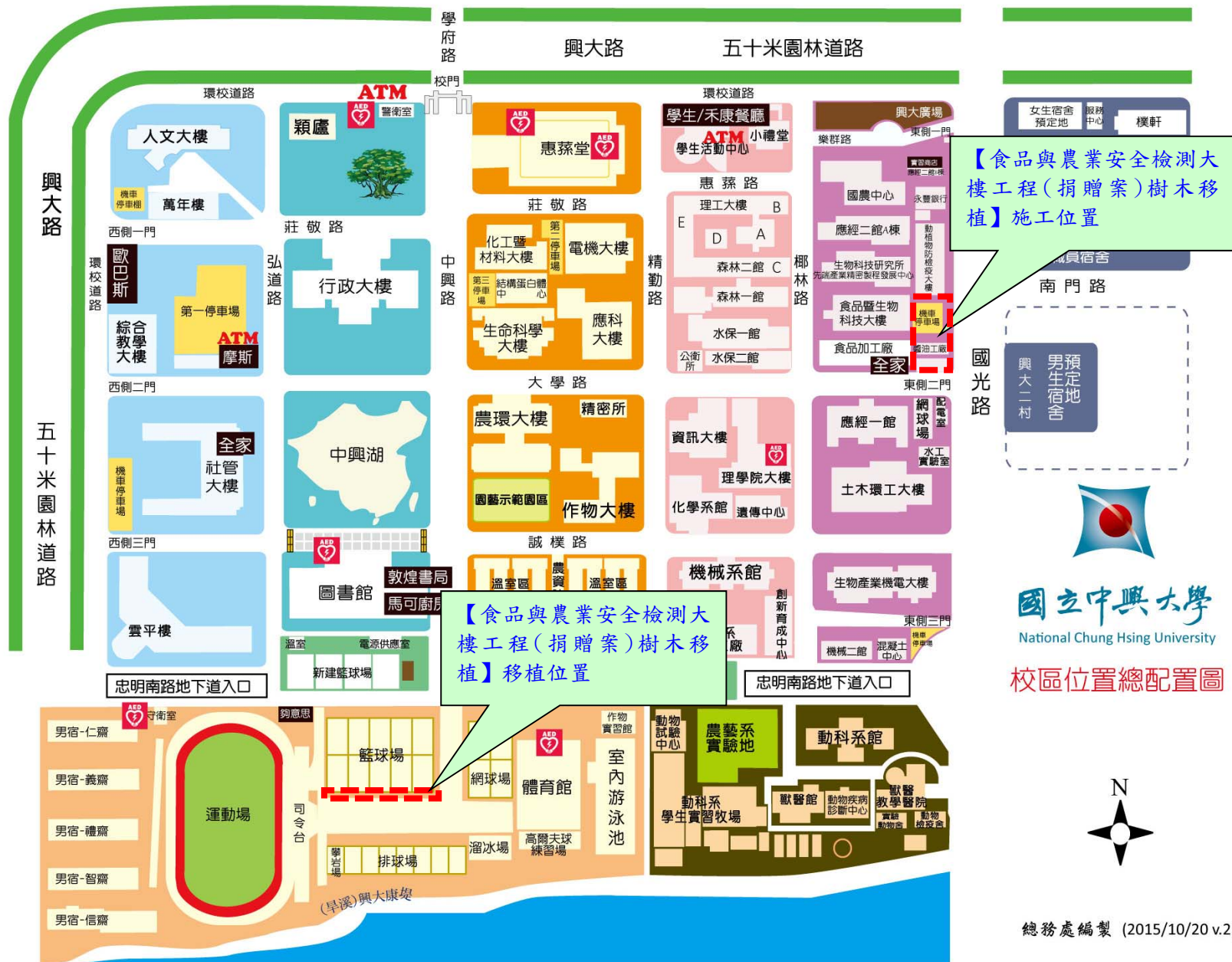
校區位置總配置圖