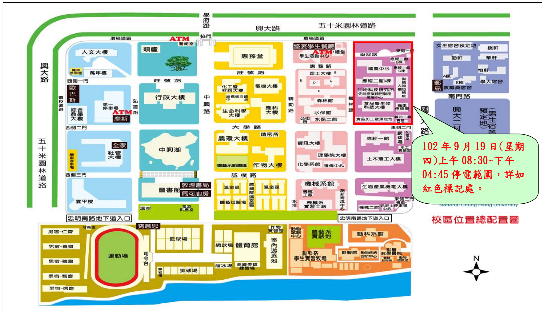
校區位置總配置圖

102年9月19日(四)食科大樓、防檢大樓及國農中心、應經二館及生物科技研究所等建築各高壓設備停電檢驗區域—詳如紅色區塊標記處