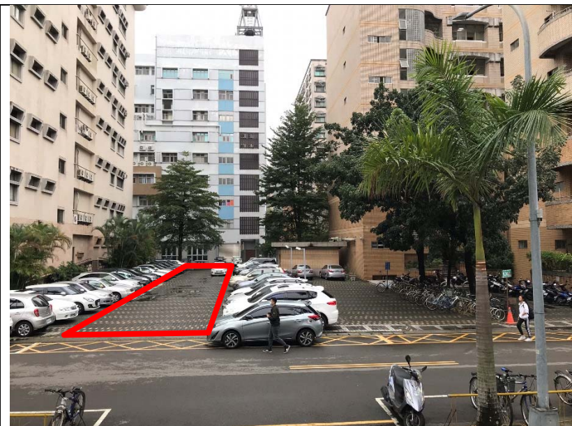
【化材館及電機大樓間停車場路面改善改善範圍】