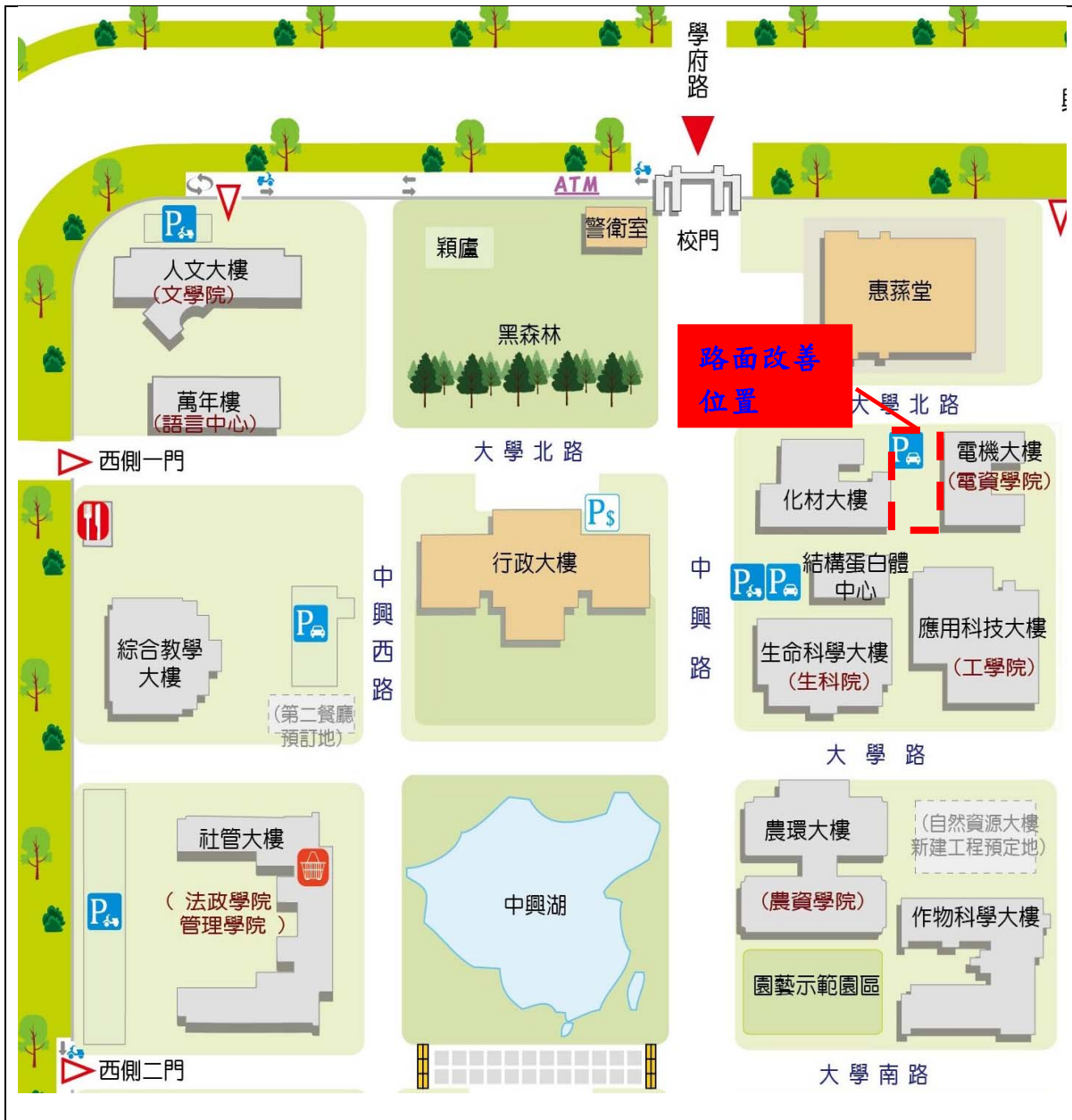
【化材館及電機大樓間停車場路面改善位置圖】