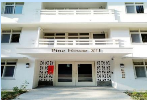
大門及機車停車處