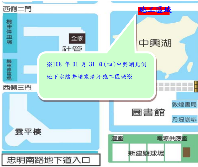
【中興湖西側施工位置示意圖】