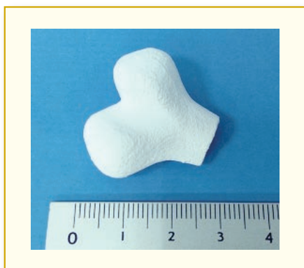
▲ 圖2 生醫陶瓷骨骼模型