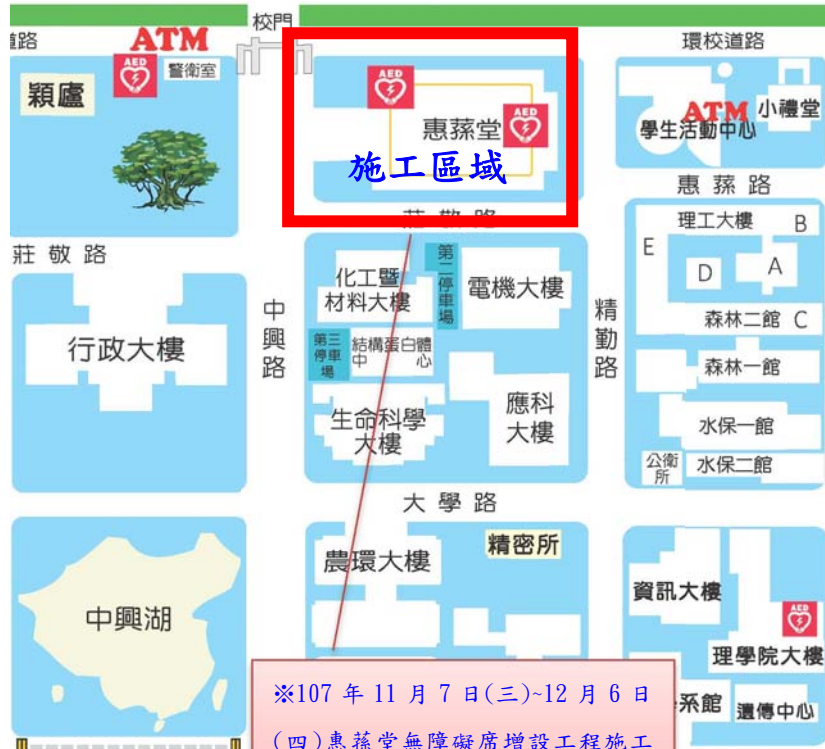
【惠蓀堂施工位置示意圖】

※107年11月7日(三)~12月6日(四)惠蓀堂無障礙席增設工程施工通知※-施工處如紅色標示區