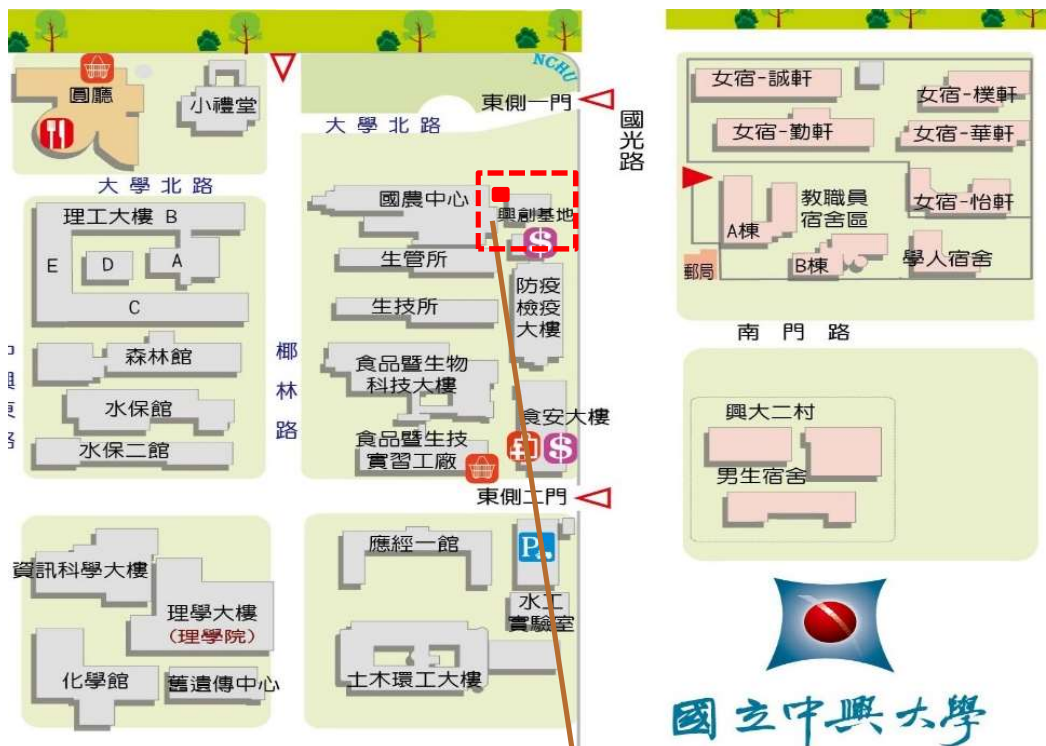
【興創基地自來水管線查修及封路地點示意圖】