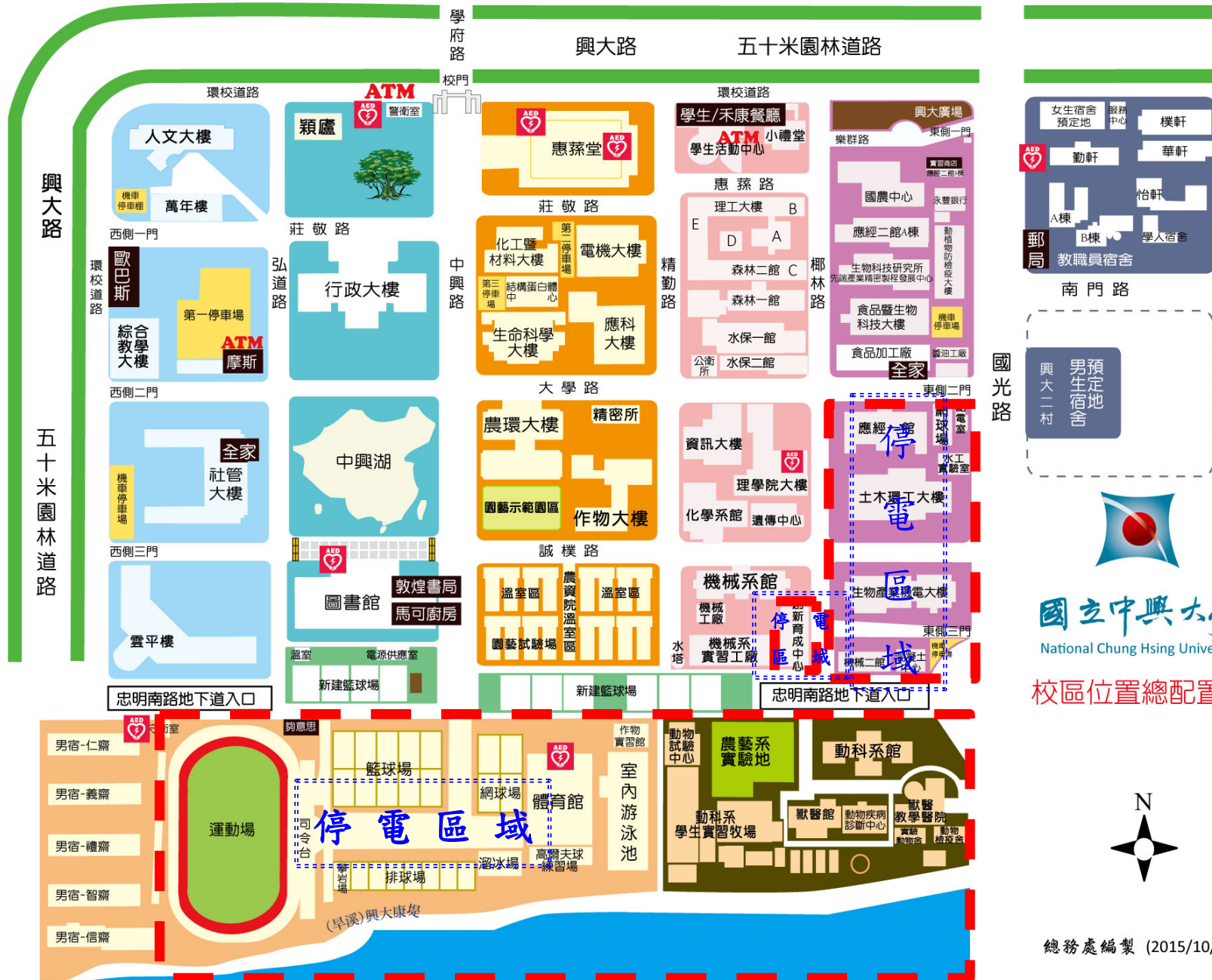
校區位置總配置圖

※105年7月30日(六)臺灣電力施工校區部分系館(獸醫館站,育成中心站,社管二館站)停電範圍如紅色標※