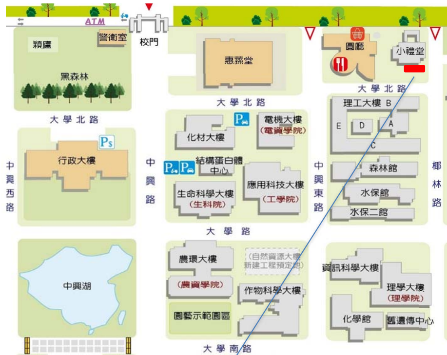
【小禮堂南側前地下幹管施工施工處示意圖】