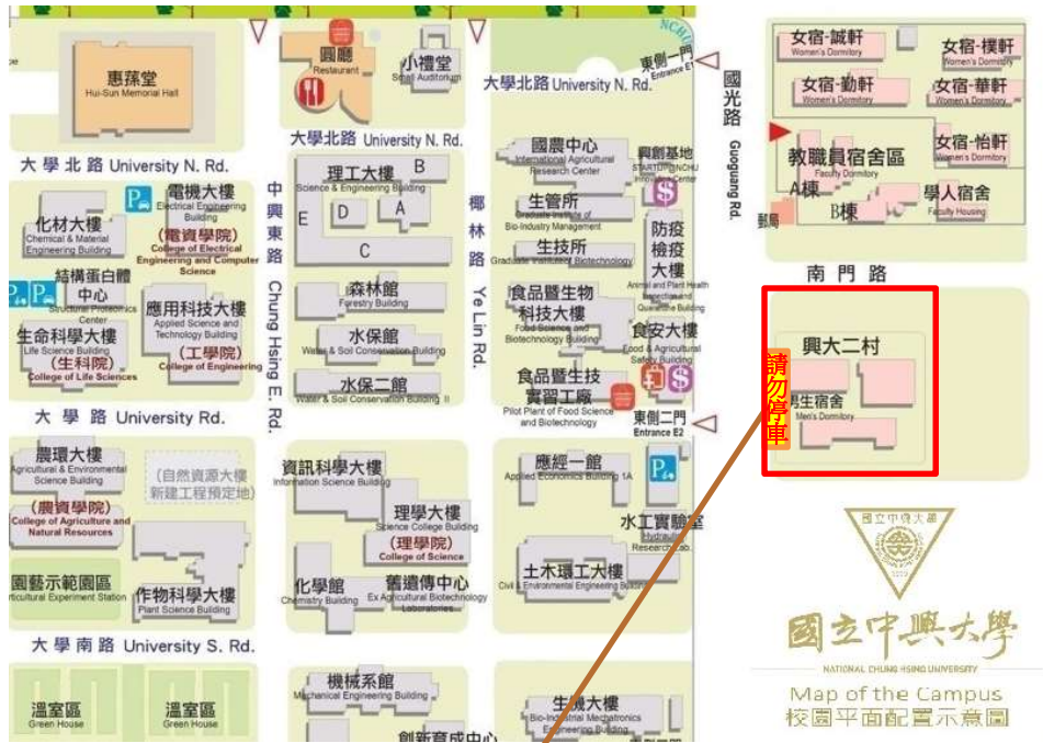
【興大二村設置圍籬及截水溝工程施工區域示意圖】