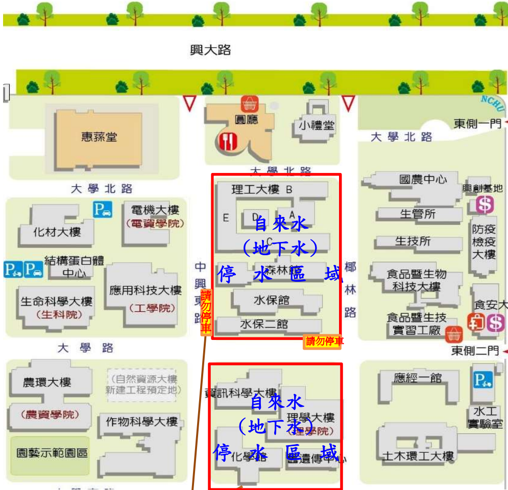
【水保系西側及南側自來水(地下水)管線破裂施工暨停水區域示意圖】