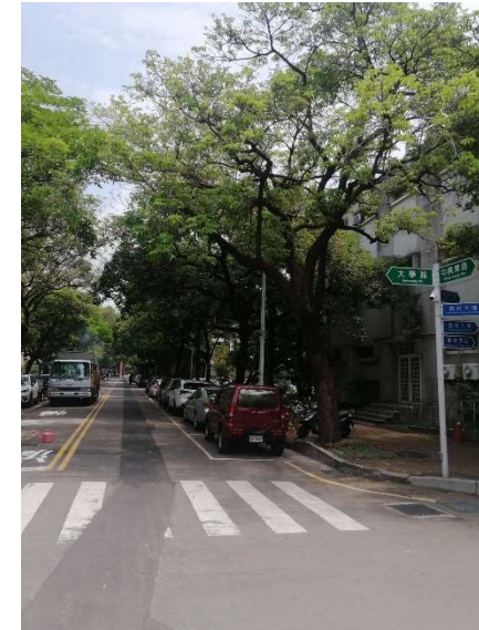
【水保系南側自來水(地下水)管線破裂施工暨停水區域】