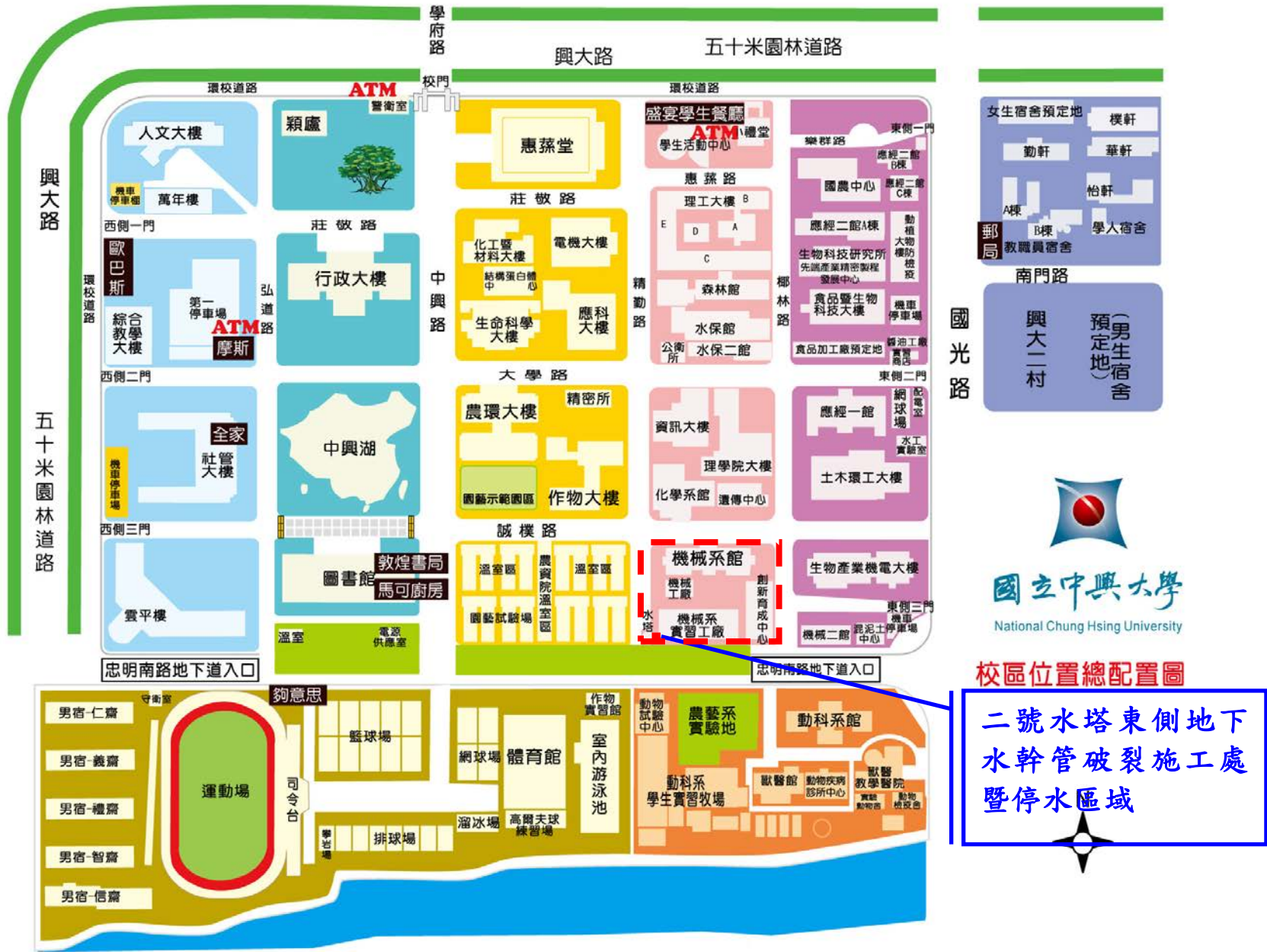
校區位置總配置圖