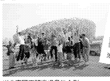
※北京國家體育場鳥巢合影。