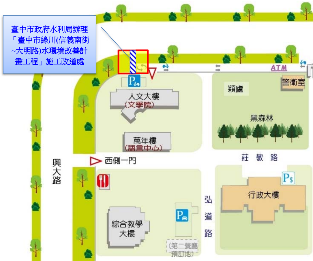
【人文大樓北側人行便道位置示意圖】