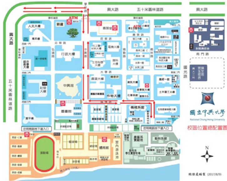
【創新育成中心混凝土車路線】