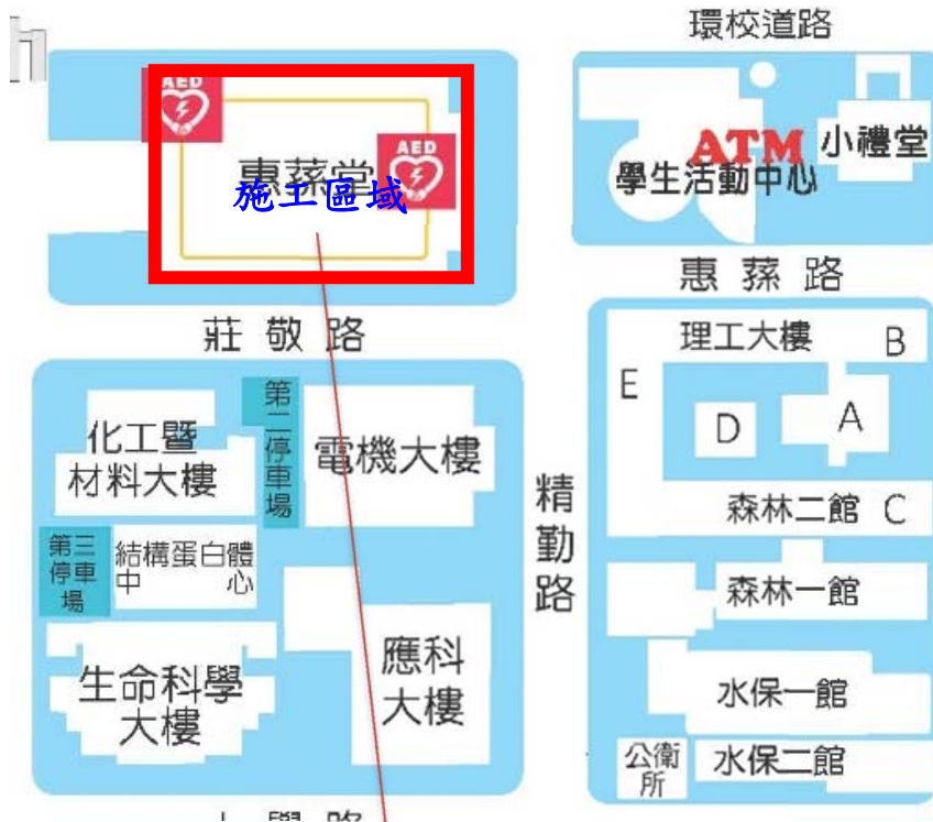
【惠蓀堂地下室現況-1】